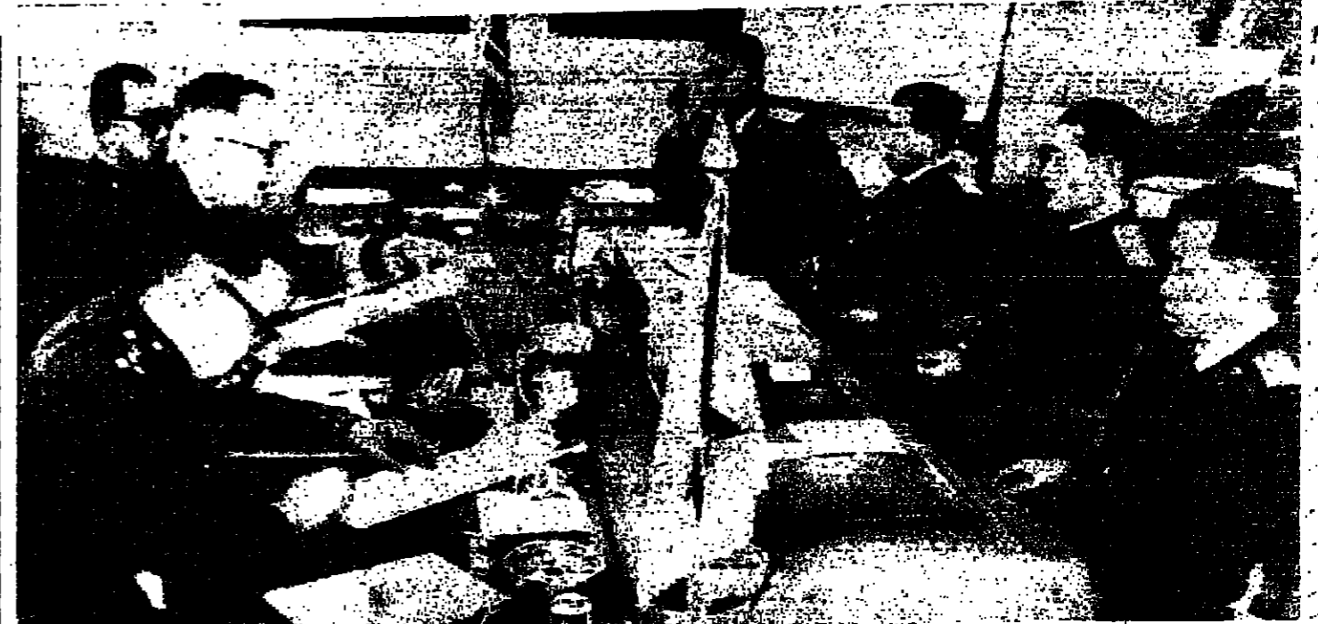
الاجيال جون سيث التيركي (في الوسط الى اليمين) لقاء اجماعه في قرية الهنحة بالجزائر باق شونغ كوك الكوري الشمالي (الذي من اليمين الى اليمين) فيليب بادامه سفينة التجسس البحرية (بيولو) وملازمهات ٨٢ وقد رفض الجنرال كوك طلب الاجيال سيث